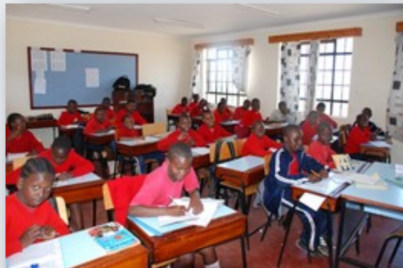
Her utvikles både kunnskap, livsglede og mestring

Landsbyen er etablert som en stiftelse som er registrert i Norge slik at de ikke kan få noen innblanding fra lokalt hold med tanke på drift og forvaltning av midler.