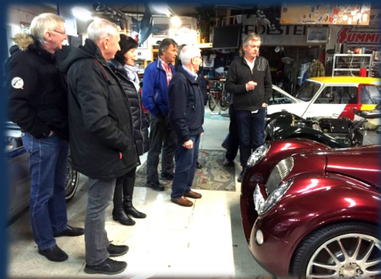
Mye nostalgi her

Jaguar er et annet bilmerke basert på engelsk design og håndverk. Bedriften startet som SS Cars Ltd i 1922. Navnet ble Jaguar i 1945. Eies i dag av et indisk selskap Tata Motors. Bilen er bygget for å vise oppsikt. Antall hestekrefter ligger mellom 300 til 500 alt etter modell. Prisen starter på 1,5mill kr og stiger raskt. Også et bilmerke som er blitt benyttet i engelske filmer for å vise engelsk storhet.