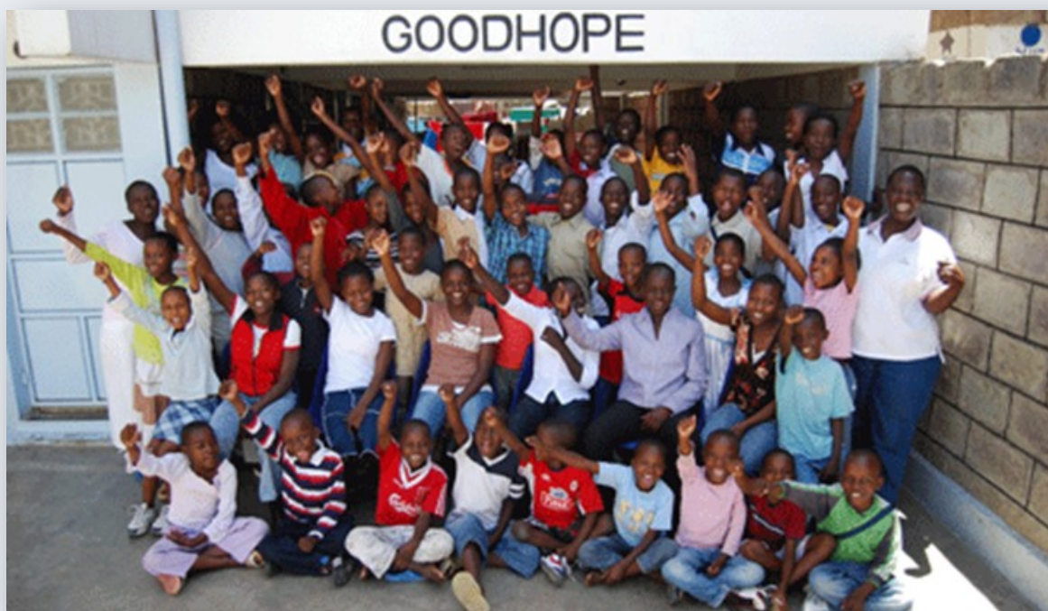
Bilde fra åpningen av Good Hope i 2009 der det da var investert 10 mill. kroner