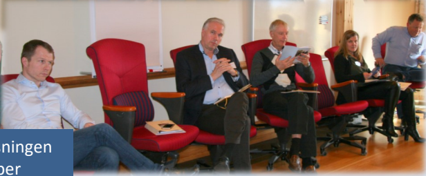
Fra undervisningen i 6 grupper